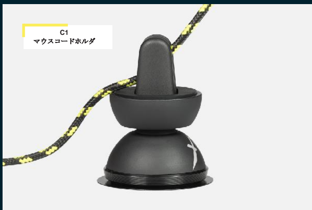
C1 マウスコードホルダ