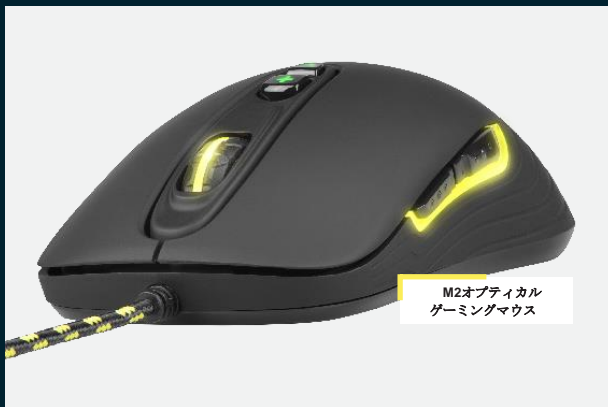
M2オプティカル ゲーミングマウス