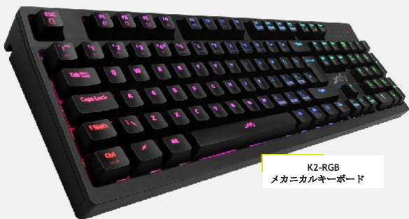
K2-RGB メカニカルキーボード